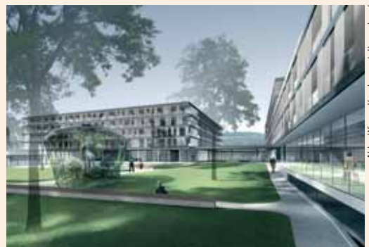
Abb.: Wiener Krankenanstaltenverbund

Im Jahr 2013 eröffnet das Geriatriezentrum Baumgarten in Wien 14 mit renovierten Pavillons plus zwei Neubauten. Im Lang- und im Hofhaus werden 336 Betten in Ein- und Zweibettzimmern untergebracht, die alle mit einer Loggia ausgestattet sind. An dem zweistufigen, EU-weit ausgeschriebenen Wettbewerb haben sich 25 Planungsteams beteiligt; gewonnen hat das Büro Ganahl/Ifsits gemeinsam mit sglw (Silbermayr/Goess/Lambert/Welzl) Architekten. Die Landschaftsarchitekten Rajek Barosch zeichnen für den Grünraum verantwortlich. Der Baubeginn soll im Jahr 2011 erfolgen, die Kosten für den Um- und Neubau belaufen sich auf 63 Mio. Euro. hui