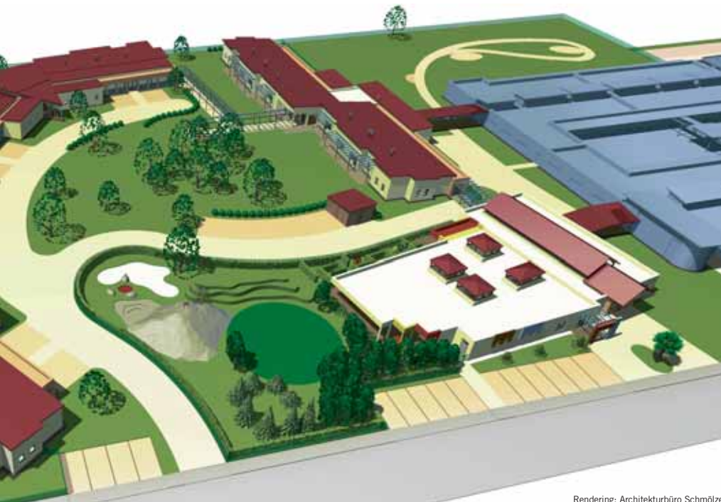
Rendering: Architekturbüro Schmölzer

Im Generationendorf Strem sind bereits die zwei Pflegeheime mit jeweils 30 Betten fertiggestellt. Drei weitere Bauteile mit jeweils acht betreuten Wohneinheiten werden demnächst realisiert. Ein Bewegungsraum und ein Kindergarten komplettieren „das Dorf“, das nach Plänen vom Architekturbüro Schmölzer im Burgenland entsteht.